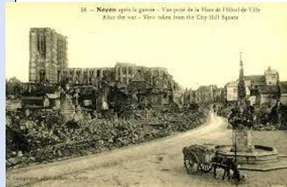
La ville de Noyon, en 1918

Le conflit a fait de nombreuses victimes : on compte 13 millions de morts et 20 millions de blessés militaires.