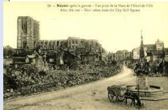
La ville de Noyon, en 1918

Le conflit a fait de nombreuses victimes : on compte 13 millions de morts et 20 millions de blessés militaires.